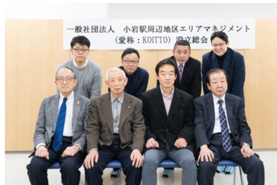
KOITTO 役員及び正会員代表者 (2020年11月16日設立総会にて撮影)