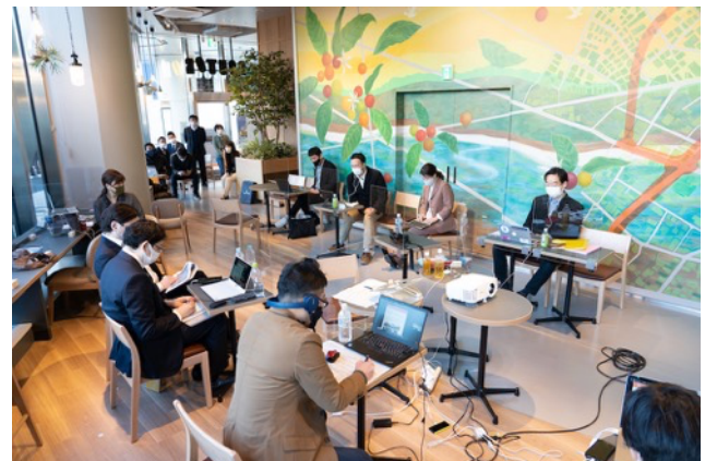
オンラインイベント中の様子。 オンライン会議にも対応できるよう無線wifiも完備。