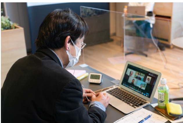
後半では小部屋に分かれて交流会を実施。 各グループごとに活発な意見交換が行われました。