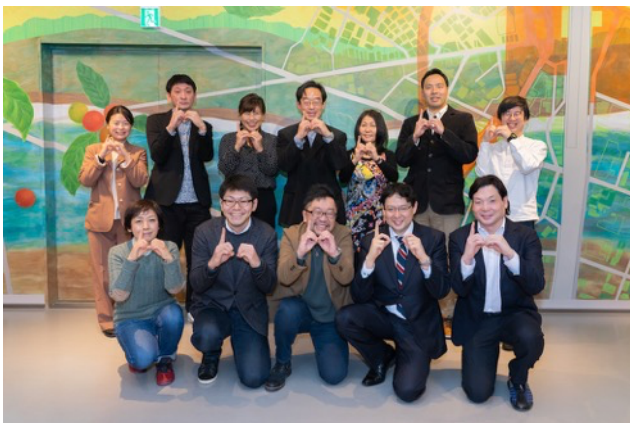
トークゲスト・運営メンバー 集合写真 (撮影のためマスクを外しています)

1月30日にKOITTO TERRACEのオープンを記念して、住民有志によるオンラインイベントが開催されました。まちで働く100人を起点に人と人をつなげる「江戸川区100人カイギ」のゲストトークの配信会場としてKOITTO TERRACEが利用され、総勢42名(オンライン)の方が参加しました。ゲストのまちに対する熱い想いに触れながら、参加者同士の交流が深まり、今後のまち運営に対する期待が膨らむイベントとなりました。